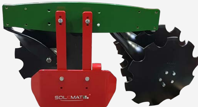
Déflecteur mobile Suivi du flux de terre