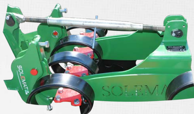
Réglage hydraulique (en option)