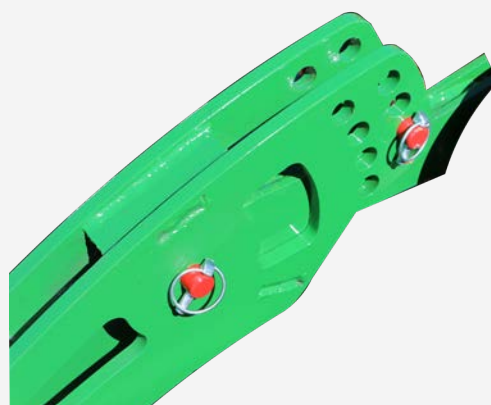
Réglage du rouleau par les axes goupillés. Rouleau barre de série adapté à la taille du cadre. Possibilité de demander d'autres types de rouleau et dimensions différentes