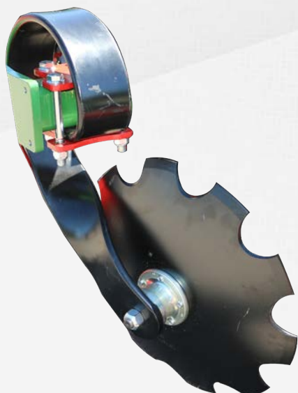
Lame ressort avec des disques de 20"